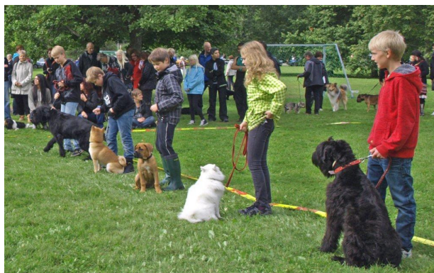
Barn med hund-deltagare